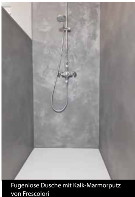
Fugenlose Dusche mit Kalk-Marmorputz von Frescolori