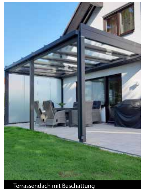
Terrassendach mit Beschattung