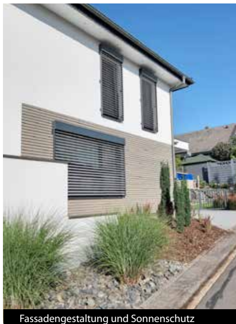
Fassadengestaltung und Sonnenschutz