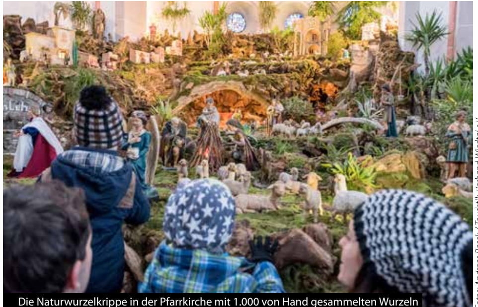
Die Naturwurzelkrippe in der Pfarrkirche mit 1.000 von Hand gesammelten Wurzeln

Dazu zählen der „Stern von Bethlehem“ - ein mit 3.500 Glühbirnen und über 30 Krippen bestückter Wanderweg, die schwimmende Krippe auf der Wied, der schwimmende Adventskranz mit 8 m Durchmesser, das Glockenspiel mit traumhaften Melodien und die Weihnachts-Illumination am 18 m hohen Zunftbaum mit 6 m Durchmesser und fast 10.000 LEDs. Insgesamt 50 Stationen befinden sich am „Kleinen Krippenweg“, der über 2 km