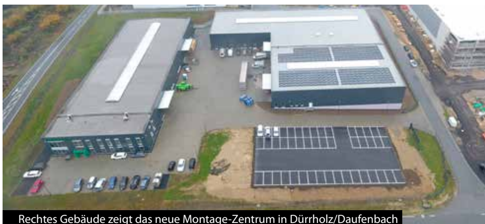
Rechtes Gebäude zeigt das neue Montage-Zentrum in Dürreholz/Daufenbach

Das nach neuestem technischem Standard konzipierte Gebäude ermöglicht nicht nur die Erweiterung der Anlagenkapazität, sondern sichert auch für die Zukunft ein Fertigungskonzept auf höchstem qualitativen Niveau. Ein erweitertes Platzangebot und die mit viel Liebe ausgestatteten Arbeits- und Funktionsräume sollen das Unternehmen für die meist aus der näheren Umgebung stammenden, oft langjährigen Mitarbeiter auch weiterhin attraktiv machen. Aktuell beschäftigt das in zweiter Generation familiengeführte Unternehmen rund 140 Mitarbeiter- Tendenz steigend.