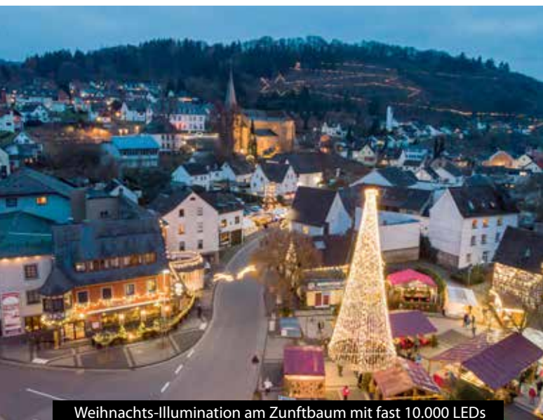
Weihnachts-Illumination am Zunftbaum mit fast 10.000 LEDs

geworden. Besonders bewertet wurde das Gesamtkonzept zum Thema Krippen und das Zusammenspiel der Akteure vor Ort.