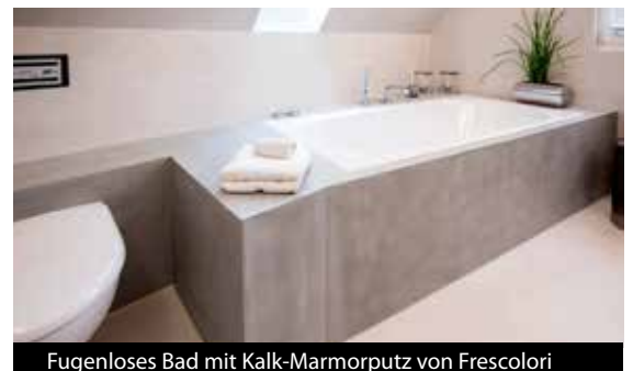
Fugenloses Bad mit Kalk-Marmorputz von Frescolori