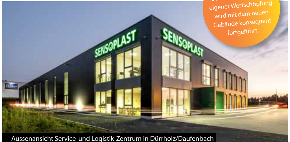
Aussenansicht Service- und Logistik-Zentrum in Dürreholz/Daufenbach

Rund eine Milliarde Schraubverschlüsse und Dosiersysteme aus Kunststoff und Elastomer werden jährlich am Standort in Oberhonnefeld, unter ISO-zertifizierten Hygienebedingungen im Kunststoff-Spritzgussverfahren hergestellt und am Standort Dürreholz/Daufenbach vollautomatisch montiert. Im Zuge des sprunghaften Unternehmens-Wachstums der letzten Jahre entstanden die Pläne zur weiteren Flächenexpansion auf dem bereits bestehenden Areal im Daufenbacher Industriegebiet „Am Kohlenweg“.